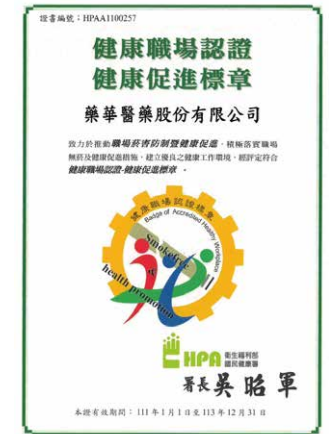
台北總部健康職場認證 / 健康促進標章