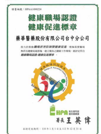
台中廠健康職場認證 / 健康促進標章