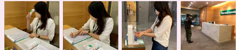
註：從左至右為量體溫、記錄體溫、雙手用酒精消毒、及環境消毒