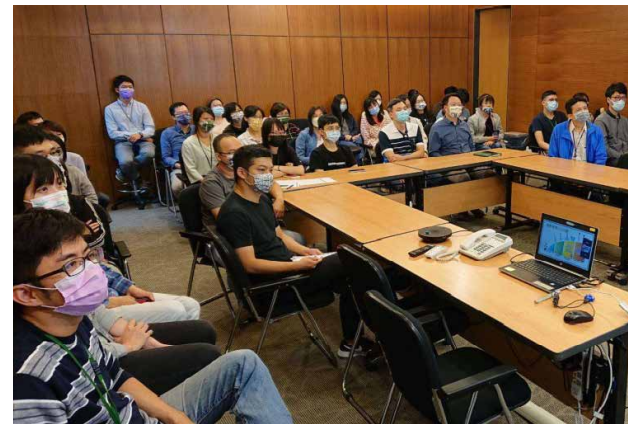
同仁參與「心血管認識與預防」健康促進講座

提供一個安全友善的職場環境是企業的承諾，也是給員工的基本保障。我們致力於降低職業傷害風險、打造使員工享有身心平衡、健康快樂的工作環境。藥華醫藥繼台中廠於 2020 年再度取得「健康職場認證 / 健康促進標章」，台北總公司也首次取得「110 年健康職場通過認證」，有效期限 3 年，肯定了本公司落實對同仁健康保護的成果。藥華醫藥提供全體員工 1 年 1 次免費且項目優於法規要求的「定期健康檢查」，讓員工盡早了解自己健康狀況及改善重點，以降低或避免疾病發生。並於 2021 年 10 月舉辦台北「心血管認識與預防」的健康講座，邀請專業醫師講解，總共 82 人次參與，出席率達 73.87%。