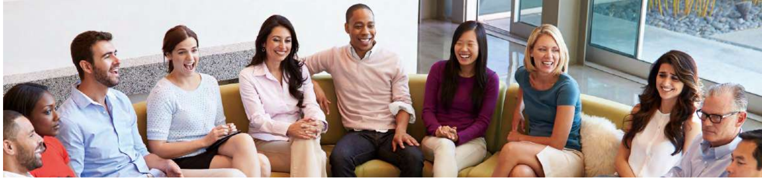
2024年人力結構表 - 藥華醫藥(臺灣)/泛泰醫療

秉持多元共融的精神，我們依照職級、學歷、年齡、性別、國籍、種族等多元化指標建立人才結構資料。至2024年底，藥華醫藥臺北總部與臺中廠總計342人，其中98.5%為臺灣員工，其餘1.5%為外籍同仁，員工男女占比約為1:1，女性主管比例達42%，已超過勞動部公布的市場平均28%，充分展現藥華醫藥持續推動性別平等與賦能的成果。泛泰醫療延續總公司對員工的承諾，由女性總經理帶領公司，積極拔擢新進人才，期待具潛力之青年人才為公司帶來創新與活力。此外藥華醫藥(臺灣)重視雇用與培育當地人才，員工組成為臺灣員工98.5%，美國員工0.9%，其他國家員工0.6%。主管層級皆為臺灣人，雇用當地居民為管理階層100%；泛泰醫療全體皆為臺灣員工；日本子公司全體皆為日本員工；美國子公司主要僱用美國員工，其他國家員工來自中國、加拿大、西班牙、臺灣。美國子公司任用亞裔、非裔、白人、夏威夷原住民或其他地區、血統雙種族或以上之員工，顯現員工任用上不受種族、地區影響。藥華醫藥(臺灣)、泛泰醫療則全數聘用亞裔員工。