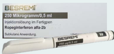
BESREMI®歐盟地區銷售商品圖

2019年Ropeg率先以商品名BESREMI®於歐盟地區上市銷售，由合作夥伴奧地利AOP Orphan公司代銷，目前於歐洲30多個國家銷售，約近千名病患使用。2022年歐洲銷貨量較去年持續成長約3倍，藥物近用的正面效益持續發酵。