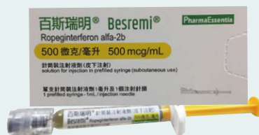
百斯瑞明®臺灣銷售商品圖

以臺灣總部為核心基地，並於韓國、日本自建專業行銷團隊，訂定行銷策略提升藥品在市場的能見度與銷售量，提供臨床病患更好的療效。Ropeg以商品名為百斯瑞明®於2020年取得臺灣食藥署核准用於治療真性紅血球增多症（PV）的藥證，已正式納入台灣健保給付藥品範疇；於2021年經韓國MFDS核准，獲得BESREMI®在亞洲的第二張藥證，2022年則亦取得澳門PV藥證，截至2023年初也已順利通過日本PMDA的查廠，其他亞太區域（中國、香港、新加坡、馬來西亞及越南等）的取證計畫也正如火如荼進行中。